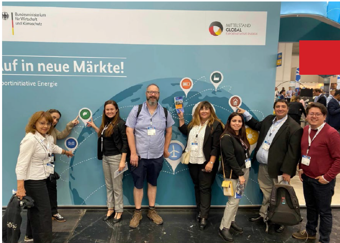
Delegación Uruguaya, del Proyecto Fortaleciendo la Transición Energética (ForTE), presente en la feria The Smarter E Europe, Alemania.

energy storage, la mayor feria de almacenaje de energías renovables y baterías de última generación; el EM-Power, como feria de tecnologías energéticas eficientes, sistemas de control inteligentes y ahorro de energía, y conceptos clave que sustentan la transición energética en la industria y el de la construcción; finalmente Power2Drive, la feria que converge proveedores, fabricantes, comerciales y start-ups en el emergente campo de la movilidad eléctrica y transporte.